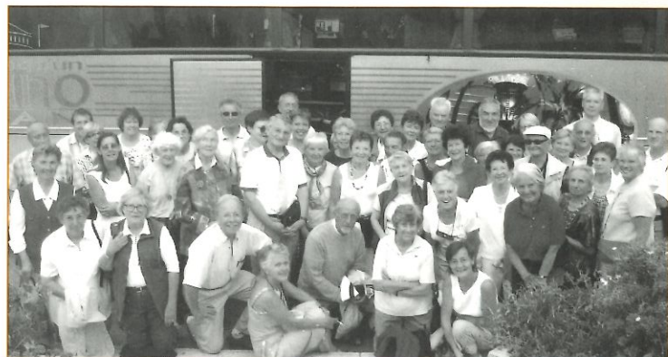
Les circuits découverte du Pays d'Evian en autocar ont eu un grand succès

Nous remercions toutes les personnes qui ont donné leur énergie et leur temps pour l'installation et les permanences et également, toutes celles qui ont prêté du matériel pour agrémenter cette exposition.